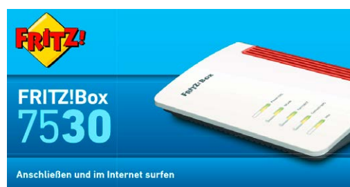
FRITZ!Box-Anleitung (je Modell abweichend)

Ihre neue FRITZ!Box schließen Sie mit dem beiliegenden Kabel an den mittleren Steckplatz der Telefondose an. Details entnehmen Sie bitte der FRITZ!Box-Anleitung.